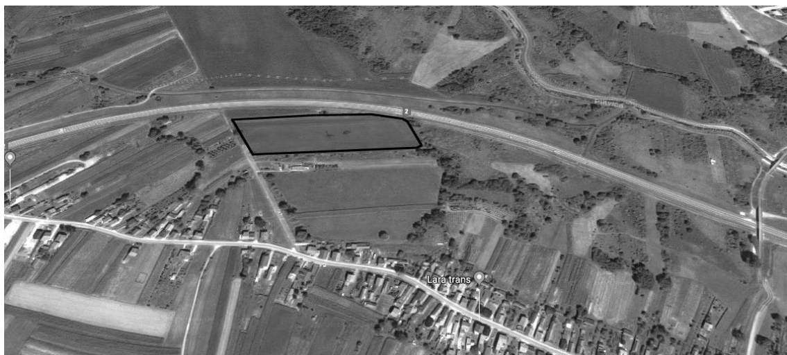
Slika 3. Potencijalna lokacija Varaždin

Varaždin kao regionalno središte te povijesno, kulturno, obrazovno, gospodarsko, sportsko i turističko središte Varaždinske županije, najstarije županije u Hrvatskoj nalazi se na raskrižju četiri velike, povijesne regije: Štajerske, Zagorja, Međimurja i Podravine 11 . U nastavku je prikazana i analizirana potencijalna lokacija.