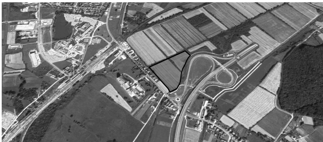
Slika 1. Potencijalna lokacija Križevci

Potrebna prenamjena zemljišta i prilagodba GUP-a. Pristupni put postoji, mogućnost direktnog priključka na prilaznu brzu cestu u smjeru Zagreba. Postojeća infrastruktura: struja, voda, odvodnja, plin.