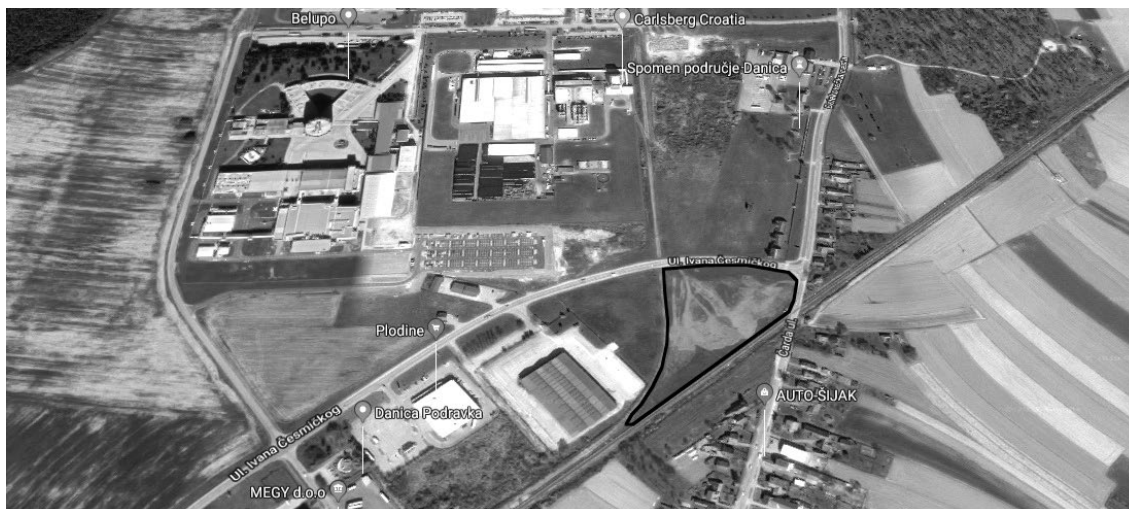
Slika 2. Potencijalna lokacija Koprivnica

Koprivnica se nameće kao potencijalna lokacija iz razloga što je središte Koprivničko-križevačke županije te se nalazi na sjecištu važnih prometnih pravaca Slovenija-Varaždin-Osijek-Srbija i Mađarska-Zagreb.